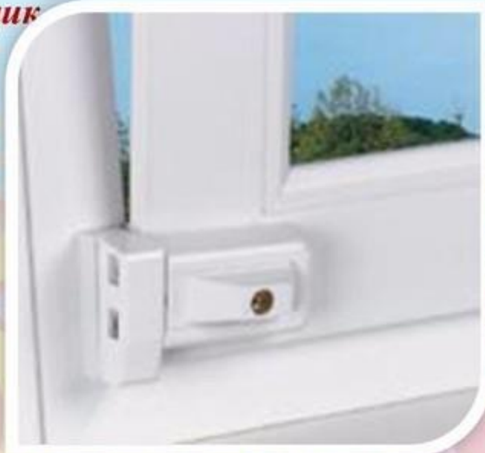
Блокировщик с кнопкой