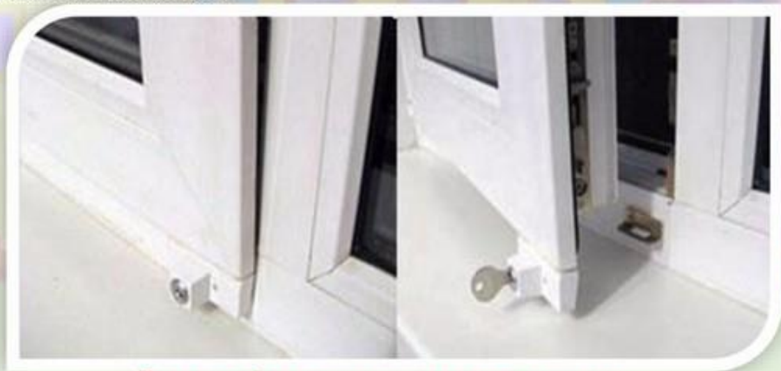
Замок блокировщик с ключом

Можно воспользоваться специальными замками блокираторами, которые предлагают установщики пластиковых окон.